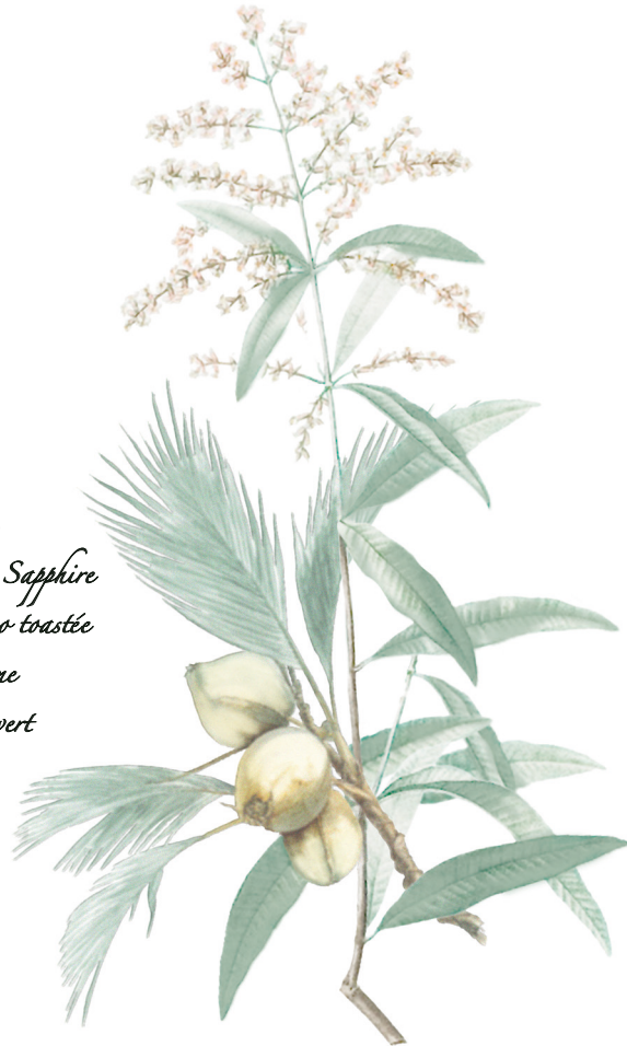
fig. 6 Gin Bombay Sapphire Noix de Coco toastée Verveine Citron vert

La verveine, originaire d'Amérique du Sud et naturalisée en Europe, dégage un parfum frais, vif et intensément citronné. Ses arômes évoquent les terrasses estivales, entre notes herbacées et zestées. Elle est prisée en infuserie, en cuisine et pour ses vertus apaisantes.