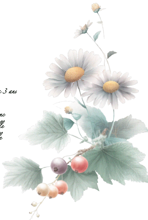
fig. 4 Rhum Havana 3 ans Suxe Porto blanc Camomille Groseille

La camomille, originaire d'Europe et d'Asie occidentale, dégage un parfum floral, doux et légèrement fruité. Ses arômes évoquent les prairies ensoleillées, entre notes de pomme verte et de miel. Elle est prisée en herboristerie, en cosmétique et pour ses vertus apaisantes et anti-inflammatoires.